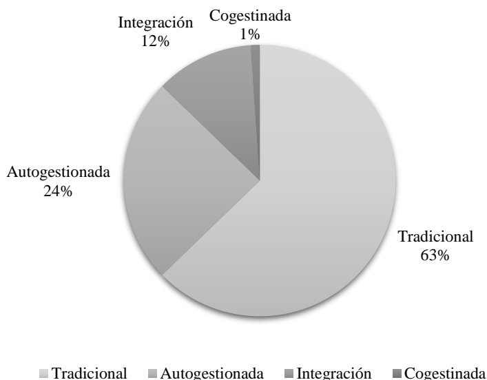
Figura 2. Distribución de las cooperativas de acuerdo con su modelo de gestión.

Y es que cuando se analizan los datos del IV Censo Nacional Cooperativo 2012 1 , se observa el crecimiento del sector, el cual pasó de 67 organizaciones en 1963 a 376 en 2012, lo cual representa un crecimiento de más del 100% (específicamente 461%), pasando de 15 654 a 887 335 personas asociadas en este mismo periodo; de acuerdo con su modelo de gestión se tiene que mayoritariamente se ubican en el modelo tradicional 2 tal y como se evidencia en la figura siguiente.